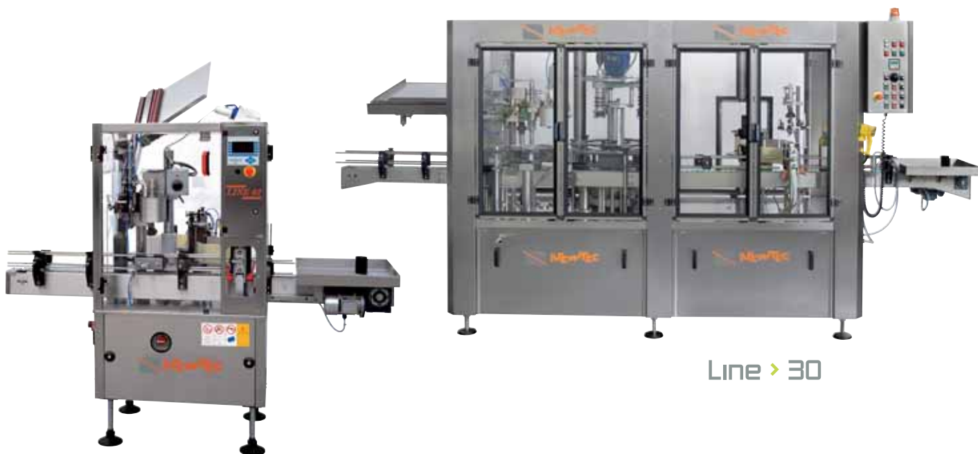
Line > 30